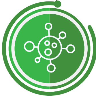
RHV 85% (Rhinovirus)