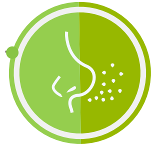
Rhinites allergiques saisonnères (pollens)