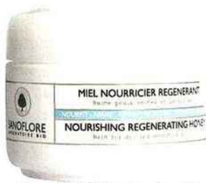
Miel nourricier régénérant, Sanoflore, 23 €.

L'hiver, c'est quasi le seul bout de peau à l'air libre. Le visage est en première ligne face aux agressions climatiques. Or, l'épiderme fonctionne au ralenti lorsqu'il fait froid. La circulation sanguine se concentre sur les organes vitaux et le flux sanguin arrivant vers la peau est moindre. Moins irriguées, les glandes sébacées trinquent et produisent moins de gras, provoquant déshydratation, dessèchement, tiraillements, picotements et rougeurs. Il faut donc rétablir la fonction barrière en lui apportant des lipides. On remplace son soin de jour habituel par des crèmes douduones, plus riches et à la texture plus onctueuse, afin de bien nourrir la peau. On fait un masque hydratant une à deux fois par semaine et, si on a vraiment la peau sèche ou sensible, on glisse un sérum hydratant sous sa crème cocoon.