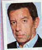
Le Dr Michel Cymes vous répond