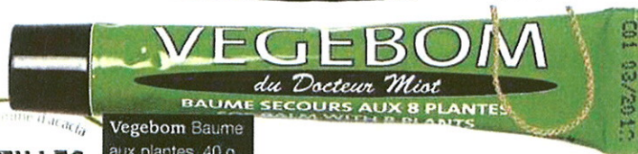
Vegebom Baume aux plantes, 40 g, 5,90 €, et pastilles gomme d'acacia, 50 g, 3,97 €.