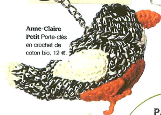
Anne-Claire Petit Porte-clés en crochet de coton bio, 12 €.