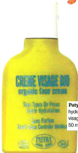
Patyka Crème hydratante visage bio, 50 ml, 8,95 €.