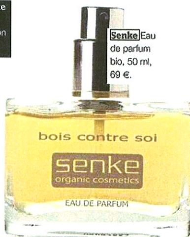
Senke Eau de parfum bio, 50 ml, 69 €.