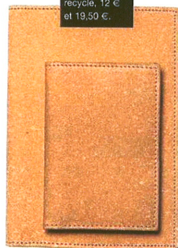
Muji Porte-cartes et porte-feuille en cuir recyclé, 12 € et 19,50 €.