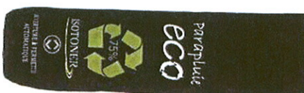
Isotoner Parapluie de sac, poignée en bambou, tissu et structure métallique en matériaux recyclés, 17 €.