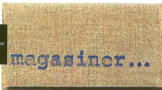
Les Petites Emplettes Porte-chéquier en lin brut, 20 €.